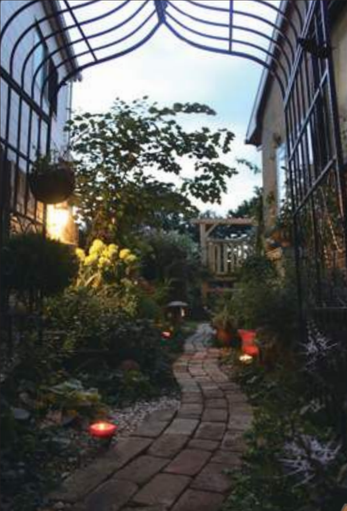
夕涼みイベント 室内では限定1日カフェ 夜までオープンガーデン開催 (2010)