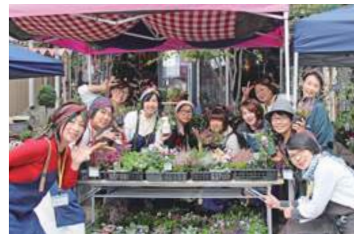
オープンガーデンフェア