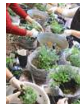
事務所や公民館などで 寄せ植え教室を定期的に行っています