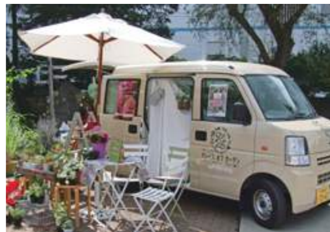
ワゴンを活用してマルシェに移動販売 (2014)