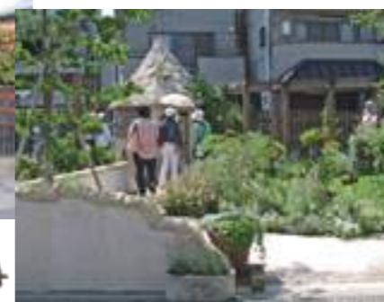
オープンガーデンバスツアー (2008)