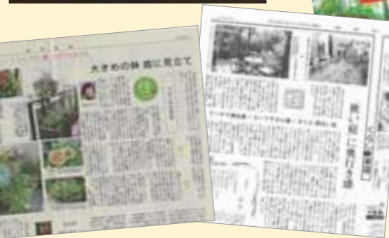
毎日新聞や読売新聞にグレイスの手掛けたお庭が掲載