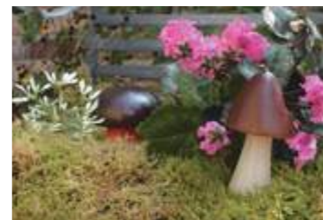
ベンチにコケときのこのディスプレイ