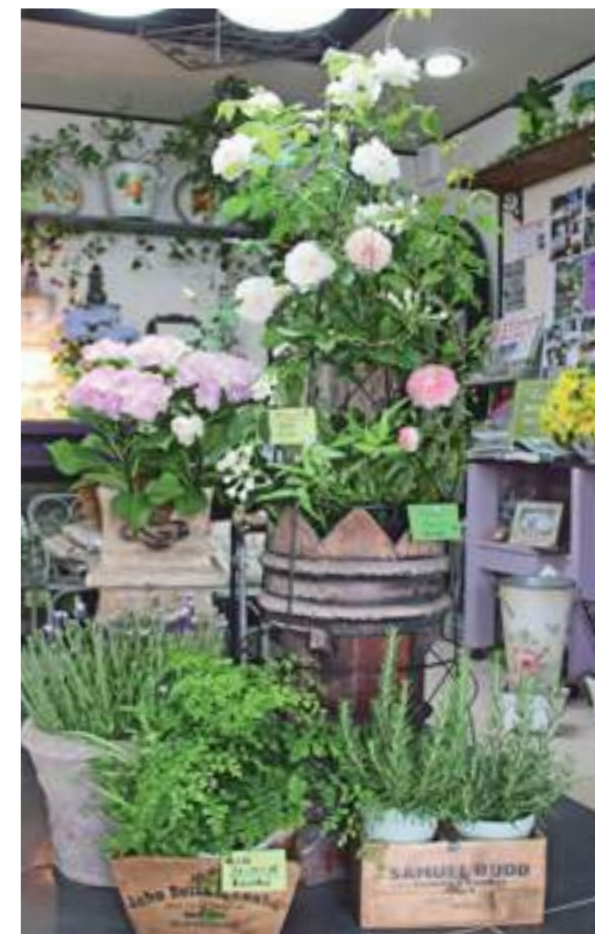
オープンガーデンフェアでは事務所内も雑貨と花苗でディスプレイ