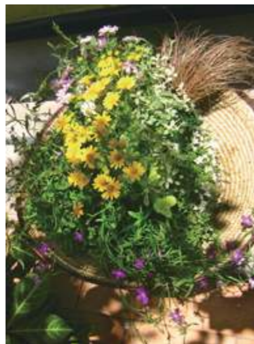
麦わら帽子に寄せ植え

マルシェ主催やオープンガーデン、ガーデン バスツアー、寄せ植え教室、キッズ教室など 様々なイベントを実施しました。多くの方々と 一緒に楽しませていただきました。