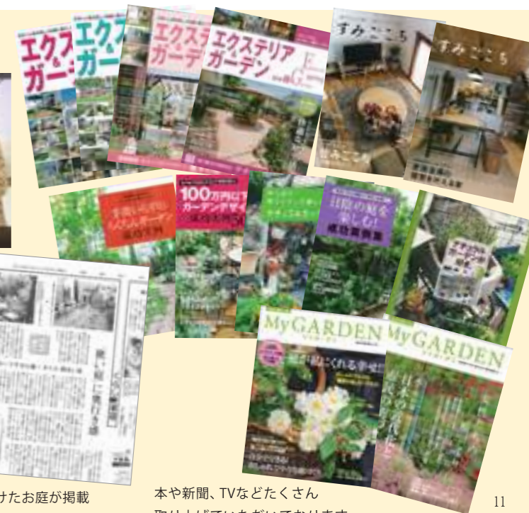
本や新聞、TVなどたくさん 取り上げていただいております