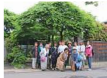
盆栽町散策ツアー (2017)