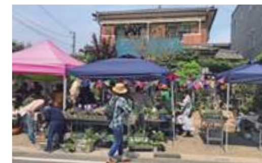
たくさんの方に来ていただいたフェア