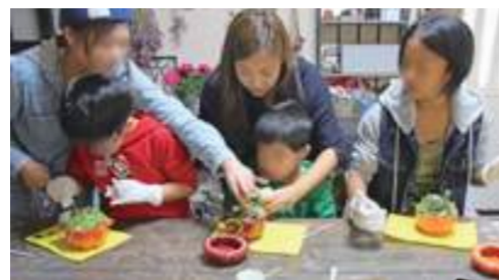
ハロウィンキッズ教室