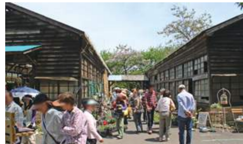
IMUZIO gardenでマルシェ“ReBirth”を開催。たくさんの店に 出店していただき、多くのお客様がいらしてくださいました (2010)